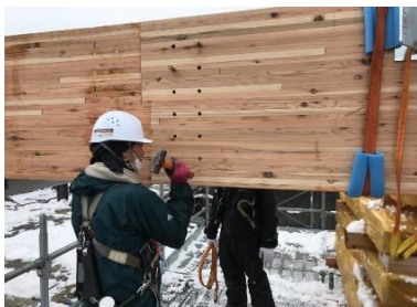
金物にドリフトピンを打込み固定します。