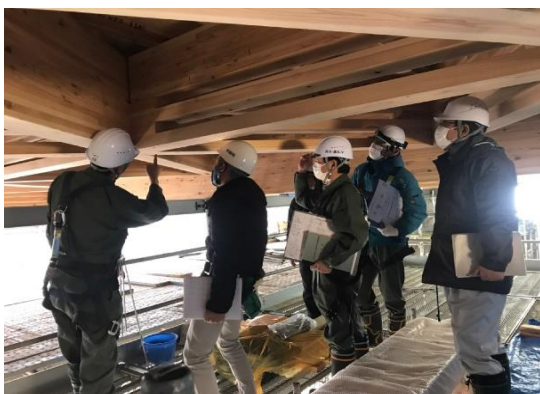
【管理棟】昇降口屋根の木軸建て方完了時検査を行いました。