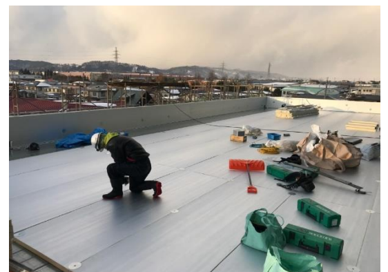
【体育館】屋上の防水は除雪をしながら懸命に進めました。