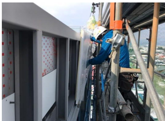
【体育館】外壁には金属系のサイディングを張っています。