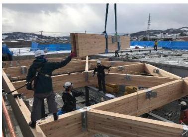
木軸組立状況です。