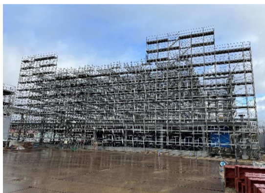
【体育館棟】足場を組立てし、11/中から鉄骨工事が再開します。