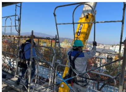
足場の組立状況です。『安全带よし！！』