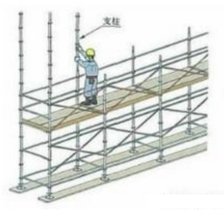
くさび式緊結足場