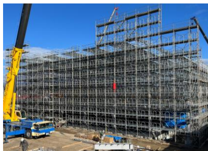
整然と組まれた足場は圧巻です。