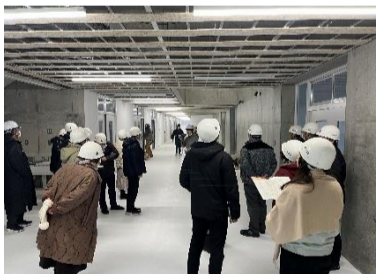
「お～!」「え～!」「いいね!」などの声が聴こえてきました。

改築工事も残すところ、あと少しです。生徒の皆さん、先生方、4月からの供用開始まで、もう少々お待ちください。