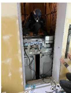
☞ エレベータの組立

内部の仕上げもいよいよ大詰めになりました。天井や壁の仕上げが終わったところから、床の仕上げを行っています。また、管理棟ではエレベータの組立も行っています。