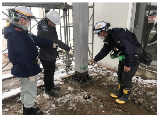
【渡り廊下】構造的な立会検査も渡り廊下で最後です。