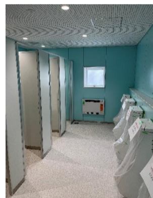
【校舎棟】きれいなトイレに仕上がっています。