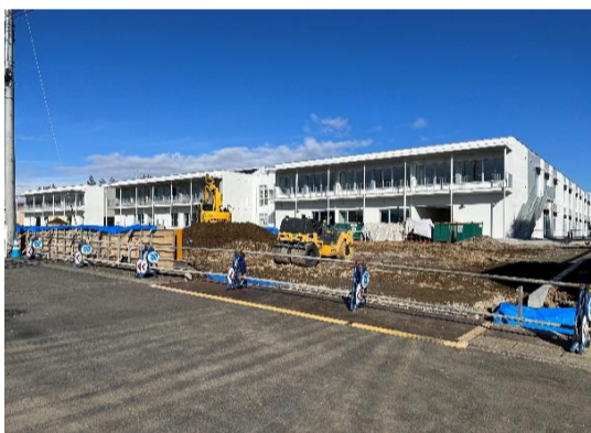
【校舎棟】外部足場の解体が完了しました。