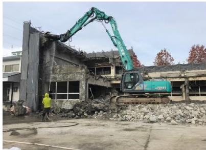
上部躯体の解体は完了です。

建屋の解体工事状況は、上部躯体の解体が完了し、基礎の解体が残り3棟になりました。建物の解体が完了した後を追いかけて、埋設配管や構内の舗装の撤去を行っています。まもなく解体工事の完了します。最後まで、ご安全に！