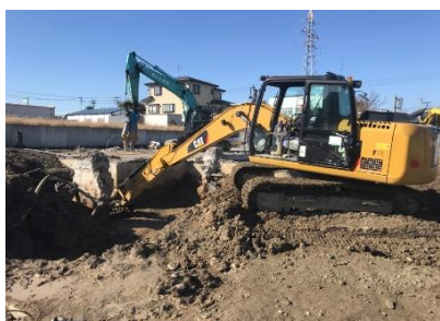
周囲を掘削してから基礎を解体していきます。解体中は、粉じんの飛散防止も忘れずに。