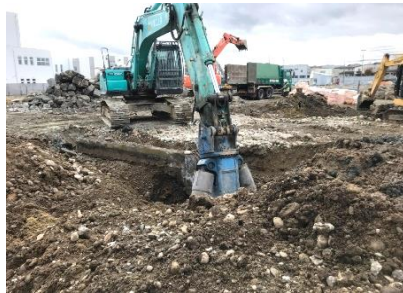
基礎、土間も縁切りしながら慎重に解体していきます。