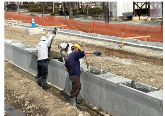
敷設が終わったら勾配調整のコンクリートを打設します。