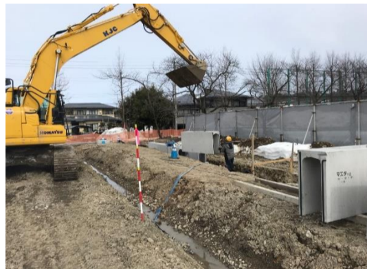
専用の吊具で側溝を吊り、慎重に並べていきます。