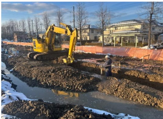
深くならないように高さを確認しながら掘削します。

グラウンドの外周を囲う、ランニングコースの側溝と縁石の敷設作業を行っています。側溝は水勾配に合わせて、深さが50cmから80cmまで数種類を使用します。側溝を所定の位置に並べ終わった後、スムーズに雨水が流れるように、側溝底部にコンクリートを打設して勾配を調整します。